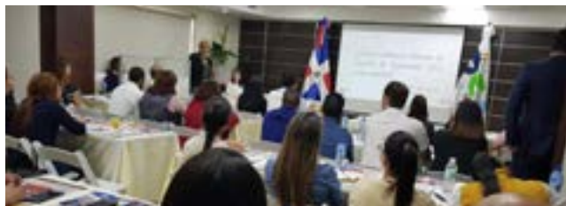
Los asistentes en el taller de OEA conocen de cerca los 7 puntos de un contenedor en un furgón que es traído a la sede central de la DGA.

El objetivo es orientar y capacitar a las nuevas empresas interesadas en alcanzar la acreditación internacional que los