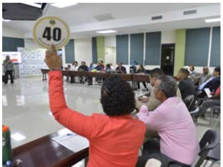
Para dar fe y certificar tanto el proceso como los resultados, actuaron un notario público y un auditor de Aduanas, la encargada del Departamento de Subasta, y los de la Bard.

En total se subastaron 303 partes y piezas de vehículos, entre otras de carros Mercedes Benz, además de tractores y equipos agrícolas, declarándose desierto solo un lote. Durante varios días, las mercancías estuvieron expuestas en el Almacén de Subasta de la DGA, para observación de los interesados.