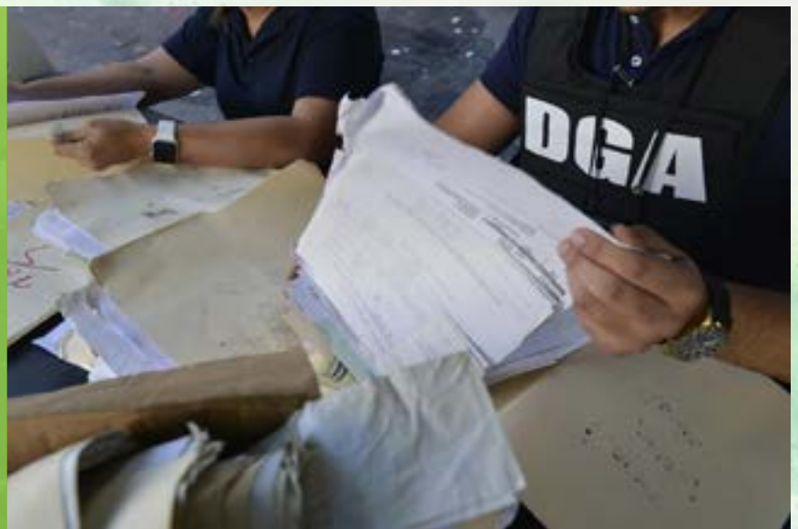
En el operativo conjunto participaron, además, el Ministerio Público, la Policía Nacional, la Dirección de Crímenes y Delitos de Alta Tecnología (DICAT), el DICRIM y el Immigration and Customs Enforcement (ICE) de los Estados Unidos.

Como resultado, hay un grupo de personas detenidas y bajo investigación por sospecha de participación en la trama, que involucra exempleados y colaboradores activos de la DGA, junto a otros ciudadanos.