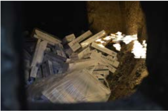
Órganos reguladores: MSP, MIC, DGA y DGII, Pro Consumidor, Indocal y un representante de cada uno de los gremios de los sectores vinculados a los productos regulados.

La reciente promulgación de la Ley 17-19 Para la Erradicación del Comercio Ilícito, Contrabando y Falsificación de Productos Regulados, representa un respaldo trascendental para las acciones que en este sentido ejecuta la Dirección General de Aduanas y la administración tributaria en general.