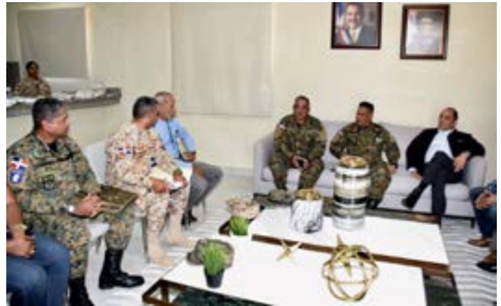
Más de 10 agencias estatales y dependencias de las FF. AA. realizan una labor conjunta de apoyo y colaboración por la seguridad fronteriza.