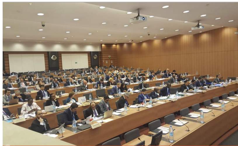
Representantes de los países miembros reunidos en la sede de la OMA en Bruselas.

Durante cinco días hubo trabajos conjuntos, mientras los distintos comités y comisiones de la OMA desarrollaron sus encuentros, pero, sobre todo, los países participaron de la elección de la secretaria general del organismo mundial, posición a la que optaban España y de nuevo Japón, que ocupa la posición desde el año 2009, resultando este último con el voto de la mayoría, por lo que Kunio Mikuriya fue ratificado en el cargo.