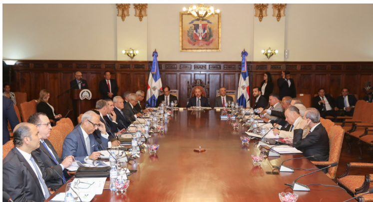
Funcionarios y miembros del sector privado que conforman el Consejo Nacional de Competitividad reunidos en torno al presidente Danilo Medina quien lo encabeza.